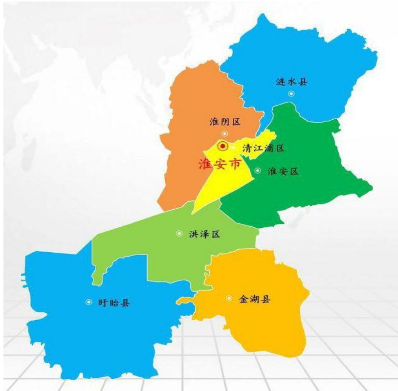
淮安市行政区划图

至此，淮安市下辖4区3县：清江浦区、淮阴区、淮安区、洪泽区、涟水县、盱眙县、金湖县。